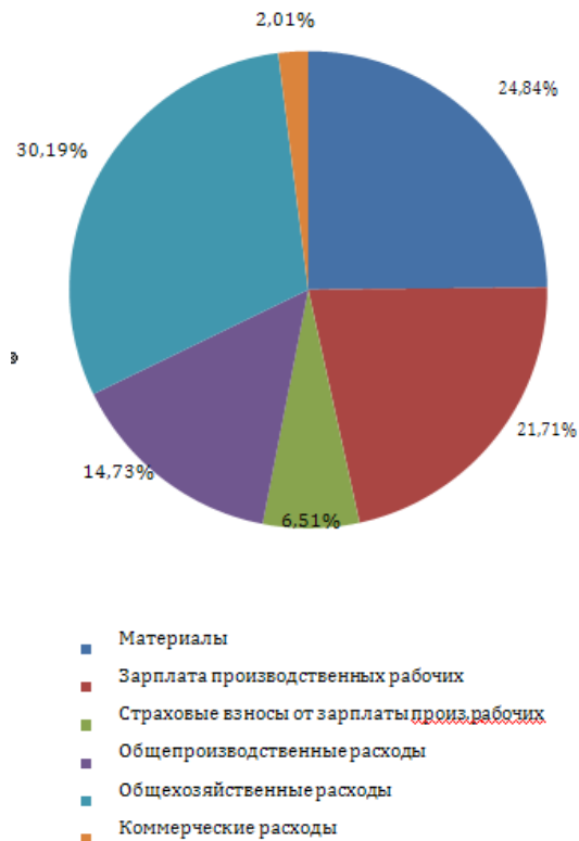
Рисунок 1- Структура калькуляции себестоимости

Оптовую цену изделия ( C_{оп} ) рассчитать по формуле (22):